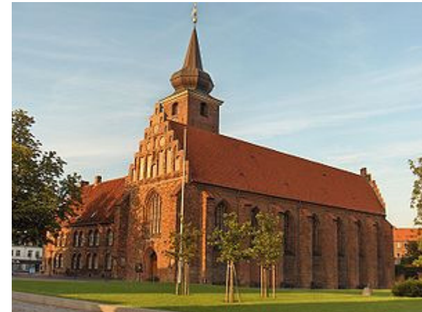
Klosterkirken i Nykøbing F